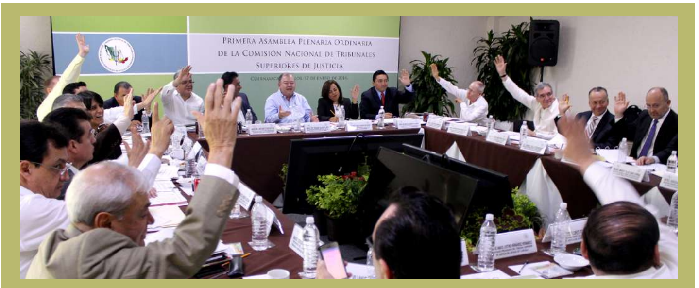
Primera Asamblea Plenaria Ordinaria de la Comisión Nacional de Tribunales Superiores de Justicia de la República Mexicana

La CONATRIB inicia un nuevo ciclo y con él una serie de desafíos que no admiten evasión, ni demora. Las administraciones anteriores de esta importante asociación han conseguido logros destacados y han fijado bases firmes para seguir materializando otros nuevos. Con estas bases, la CONATRIB está llamada a jugar un papel estratégico en los cambios que las reformas estructurales imponen a la realidad nacional porque nadie como nuestra asociación tiene la visión completa de las necesidades y posibilidades de la justicia local y de sus repercusiones en todas las esferas de la sociedad. En este contexto, es nuestro deseo que el presente boletín sea útil a la inclinación natural que todos los tribunales tienen para compartir información jurídica de vanguardia e interés especializado para el juzgador y el jurista, así como para conformar un espacio abierto para la difusión de los retos, los quehaceres y los logros de la CONATRIB, y de cada uno de los tribunales que la integran. ☺☺