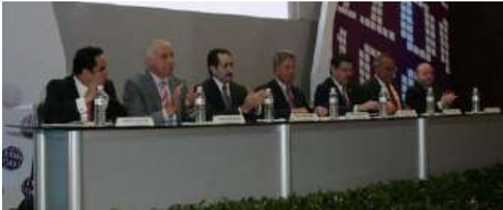
Integrantes del presidium inaugural.

Los pasados 28 y 29 de agosto se llevó a cabo el Foro Internacional de Protección de Datos Personales en Materia Judicial en las instalaciones del Poder Judicial de Nuevo León con la colaboración de la Universidad Autónoma de Nuevo León (UANL) y la Comisión Estatal de Transparencia y Acceso a la Información.