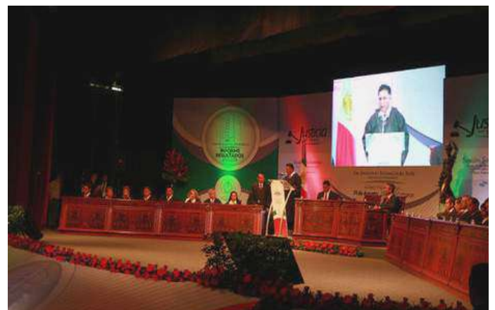
El Dr. Apolonio Betancourt Ruiz durante la presentación de su informe.

Al concluir su informe, el Dr. Betancourt dejó en claro que el Estado de Durango se perfila para ser un nuevo polo de desarrollo para el país, es por ello que reafirmó su compromiso para seguir trabajando a favor de la justicia.