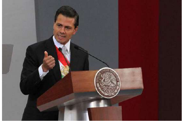
Lic. Enrique Peña Nieto dando su mensaje con motivo del Segundo Informe.

5.- Reducción de la violencia. El Ejecutivo destacó que en lo que va de la Administración se han neutralizado 84 de los 122 delincuentes más peligrosos. Indicó que de acuerdo con los datos anuales del INEGI, en 2013 hubo 12.5% menos homicidios que en 2012.