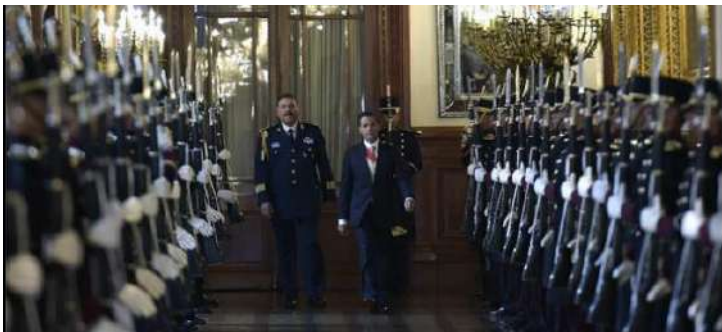
Lic. Enrique Peña Nieto recibiendo el saludo como Jefe de las Fuerzas Armadas, en su camino al patio de Palacio Nacional.

4.- Garantizar la reforma educativa. Peña Nieto reconoció que la reforma educativa ha enfrentado resistencias en algunas regiones del País, sin embargo, garantizó que será aplicada en las 32 entidades federativas con el apoyo de autoridades, docentes y padres de familia.