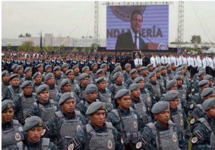
Lic. Enrique Peña Nieto durante la presentación de la Gendarmería.

La misión de la Gendarmería, de acuerdo con un texto difundido por la Presidencia en su página web, es salvaguardar la seguridad de las personas y sus bienes “para proteger las fuentes de empleo derivadas de los ciclos económicos y productivos”. Se caracterizará por su itinerancia, “pues sus elementos se desplazarán conforme a diagnósticos criminológicos y económicos para brindar seguridad en las zonas, territorios y puntos estratégicos que le sean asignados, durante el tiempo que se requiera”.