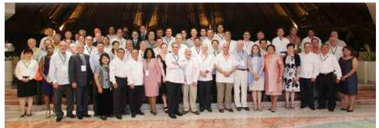
Asistentes a la Sexta Cumbre Iberoamericana.

Presidentes de 24 tribunales electorales de Iberoamérica concluyeron la VI Cumbre Iberoamericana sobre Justicia Electoral, en la que se comprometieron a hacer visibles las aportaciones de la justicia electoral, intercambiar información, herramientas y buenas prácticas para mejorar la labor jurisdiccional, así como a dar continuidad a la cooperación institucional.