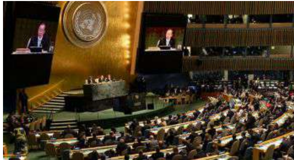
Ban Ki-Moon, durante su discurso inaugural en la Cumbre.

Ban Ki-Moon declaró que no estaban ahí para hablar sino para hacer historia. Así los líderes prometieron cinco mil millones de dólares para ayudar al mundo a ser más sostenible. Cantidad burlesca si consideramos, por ejemplo, que a nivel mundial el costo de la crisis financiera 2007-2008, reflejado en inyecciones de liquidez y paquetes de rescate (capitalización y garantías de créditos interbancarios) de los países desarrollados era, en octubre del 2008, de $8.4 billones de dólares.