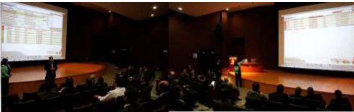
Presentación del Sistema Informático de Control de Gestión Judicial.