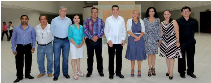
Dr. Rutilio Escandón Cadenas y la Dra. Olga María del Carmen Sánchez Cordero de García Villegas, con los integrantes del Comité de Equidad de Género.

El Poder Judicial de Chiapas tuvo la distinción de contar con la visita de la Ministra de la Suprema Corte de Justicia de la Nación, Dra. Olga María del Carmen Sánchez Cordero de García Villegas, quien se reunió con el Comité del Modelo de Equidad de Género que existe al interior del Poder Judicial del Estado, con el fin de intercambiar experiencias y conocimientos para fortalecer las acciones encaminadas a proteger la integridad de las mujeres.