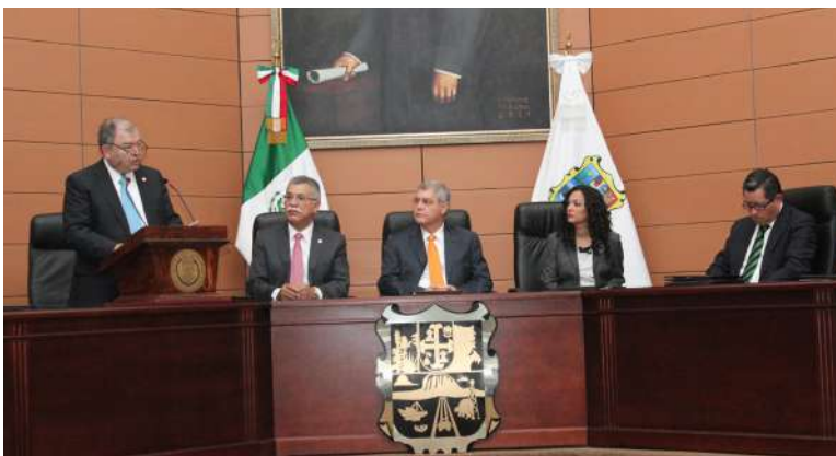
Dr. Edgar Elías Azar durante su discurso.

"Hay que insistir todo el tiempo, que se escuche claro y fuerte, las mujeres están aquí, pero están aquí para quedarse, para no dar un solo paso atrás, nunca otra vez en la penumbra, jamás debemos estarles escamoteando logros, al contrario, debemos ir hombro con hombro como dijera el poeta del brazo y por la calle, compartiendo vida de igual a igual con todos", puntualizó el Dr. Elías Azar.