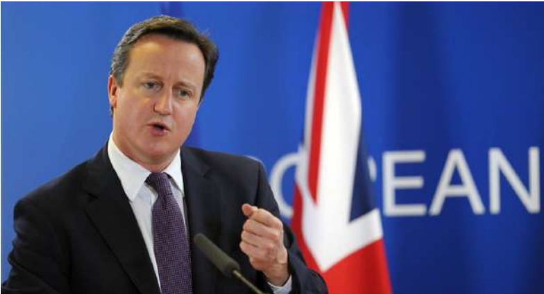
Primer Ministro Británico, David Cameron.

El partido conservador del Primer Ministro Británico, David Cameron, ha advertido que el Reino Unido podría renunciar el año próximo a la jurisdicción del Tribunal Europeo de Derechos Humanos si éste no admite que solo Londres tendrá la última palabra sobre si acepta o no los dictámenes de la Corte de Estrasburgo.