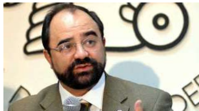
Mtro. Emilio Álvarez Icaza.

Expertos de las Naciones Unidas (ONU) y de la Comisión Interamericana de Derechos Humanos (CIDH) se pronunciaron por que el Gobierno mexicano realice una investigación rápida sobre la presunta ejecución de civiles a manos del Ejército en Tlatlaya, Estado de México.