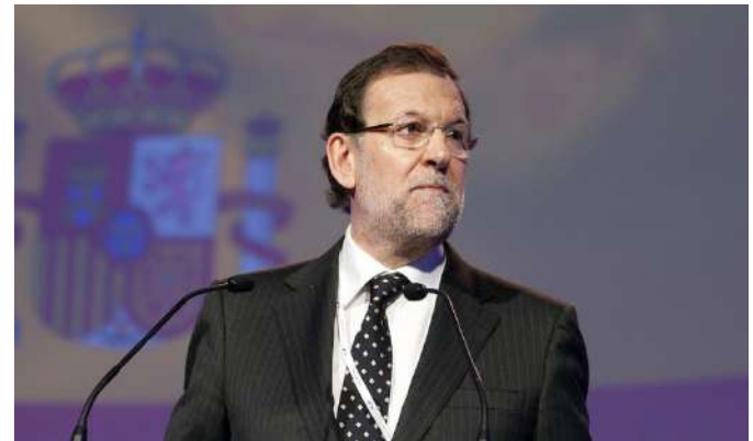
Mariano Rajoy, Presidente de España

El Presidente Rajoy solicitó que la admisión a trámite de los recursos implicará la suspensión de la vigencia de las resoluciones adoptadas en el desafío soberanista catalán.