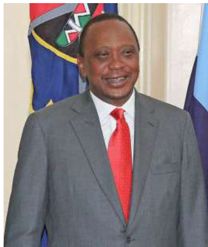
El Presidente Uhuru Kenyatta.

próximos días unos 150 diputados de la nación africana podrían viajar a La Haya en apoyo del mandatario.