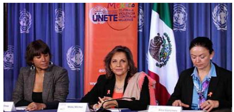
ONU-Mujeres durante la presentación de la campaña "Únete".