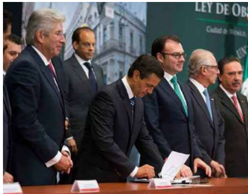
Lic. Enrique Peña Nieto, durante la firma de la iniciativa de reforma.

“El objetivo es facilitar la contratación y ejecución de las obras públicas, agilizando los procedimientos y garantizando que los recursos se administren, como lo mandata la propia ley, con eficiencia, eficacia, economía, transparencia y honradez, tal como lo señala el artículo 134 Constitucional”, dijo el Presidente, quien también aseguró que entre enero y septiembre del 2014 se destinaron en inversión física 132 millones de pesos más que en el 2012, es decir 638 mil millones de pesos a la inversión física.