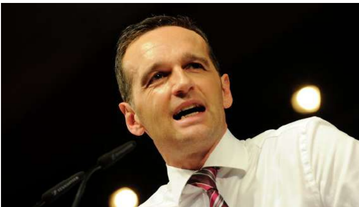
Ministro Heiko Maas.

El Parlamento alemán aprobó un endurecimiento de la ley que fija penas por delitos sexuales para proteger mejor a los menores, la ley convierte ahora en delito fotografiar a niños o jóvenes para vender o intercambiar las imágenes, retrasa la prescripción de delitos sexuales y amplía el castigo al cyber-grooming , que consiste en el intento de un adulto de contactar menores a través de internet para mantener relaciones con ellos.