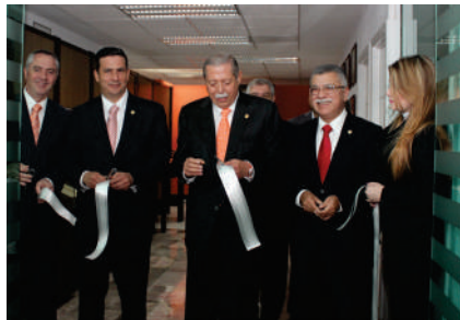
Inauguración de la “Exposición de Expedientes Judiciales Históricos”.