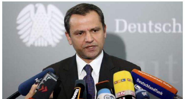
Exdiputado Sebastian Edathy.

“Nadie debe ganar dinero con el cuerpo de niños o jóvenes”, señaló el Ministro de Justicia Heiko Maas tras la aprobación del endurecimiento de la ley.