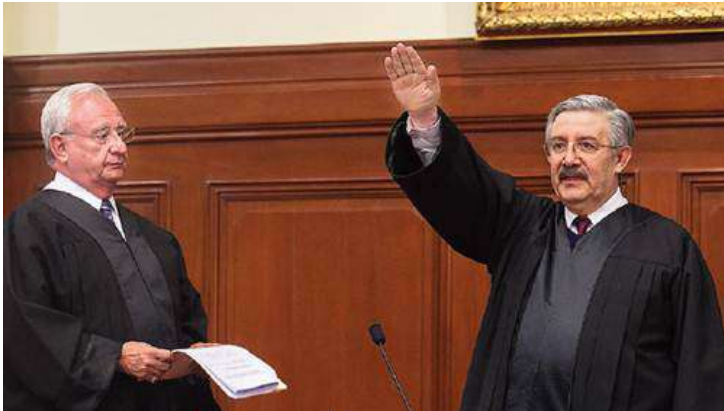
Toma de protesta como Presidente de la SCJN al Ministro Luis María Aguilar.

El Ministro Luis María Aguilar Morales fue designado Presidente de la Suprema Corte de Justicia de la Nación y del Consejo de la Judicatura Federal. El Ministro Aguilar ocupará el cargo referido durante los próximos cuatro años, como establece la Constitución Federal y el reglamento interno de este organismo.