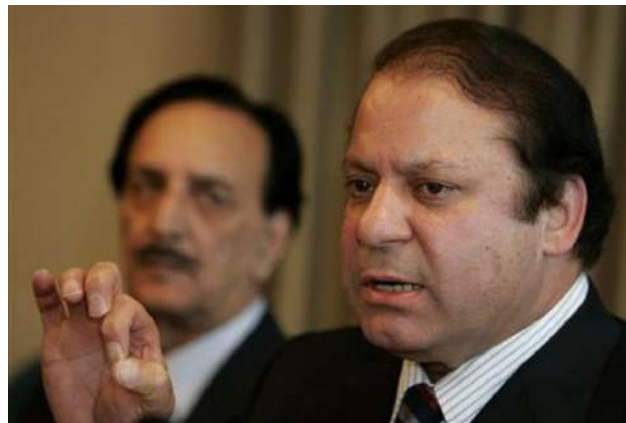
Nawaz Sharif, Primer Ministro de Pakistán.

Con la aprobación de la enmienda constitucional, los sospechosos que sean condenados por tribunales militares ya no tendrán derecho a presentar recursos de apelación. El Primer Ministro paquistaní, Nawaz Sharif, defendió