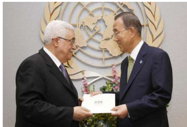
Ban Ki-moon y Mahmud Abás.

El Secretario General de la Organización de las Naciones Unidas (ONU), Ban Ki-moon, a través del sitio de tratados de la ONU, anunció que el Estado de Palestina se unirá a la Corte Penal Internacional (CPI), y que aceptará sus documentos, apuntando que "El estatuto entrará en vigor el 1° de abril del 2015". Esta medida permitirá a los palestinos presentar cargos por crímenes de guerra contra Israel.