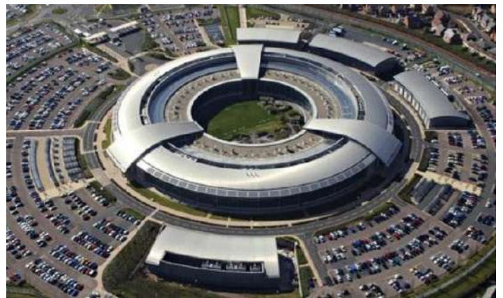
Cuartel General de Comunicaciones del Gobierno.

El diario explicó que el reporte se basa en un análisis de documentos realizado por el excontratista de la Agencia de Seguridad Nacional de Estados Unidos, Edward Snowden. De acuerdo con el reporte, los correos electrónicos de los periodistas eran parte de un conjunto de 70 mil correos recabados en menos de 10 minutos en noviembre de 2008.