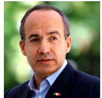
Lic. Felipe Calderón Hinojosa.