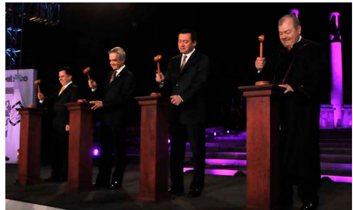
Arranque del Nuevo Sistema de Justicia Penal con el tradicional golpe de mallete.