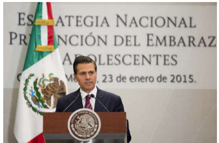
Lic. Enrique Peña Nieto durante la presentación de la Estrategia.

El Secretario de Gobernación, Miguel Ángel Osorio Chong, dijo que la estrategia busca “que en México no haya un solo