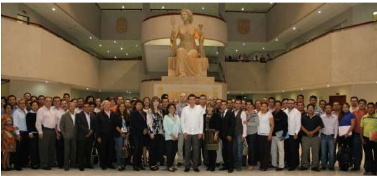
Alumnos del curso taller “Código Nacional de Procedimientos Penales”.