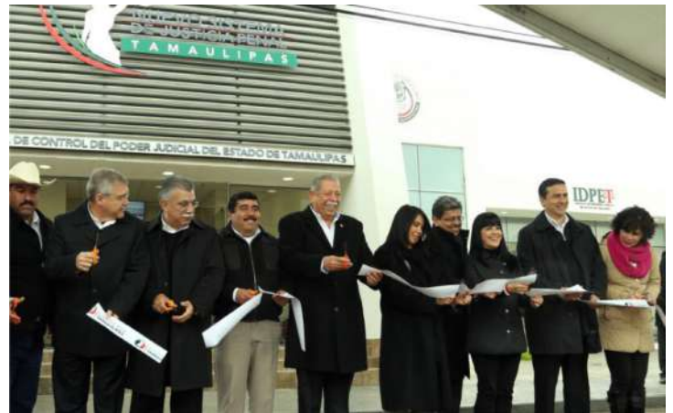
Inauguración del Centro Integral de Justicia Penal en el municipio de Padilla.