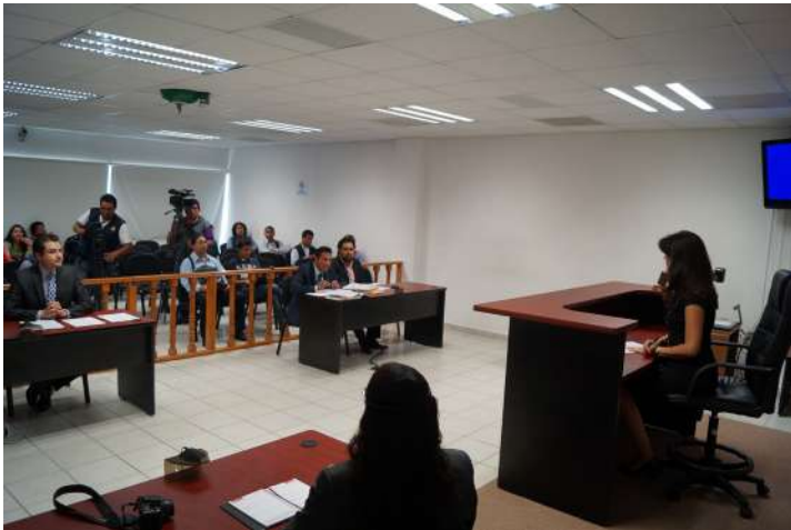
Juzgado Oral Penal del Poder Judicial de Querétaro.

Tras el arranque del Nuevo Sistema de Justicia Penal en el Estado de Querétaro se han realizado a la fecha más de 180 audiencias en los 15 municipios que la operan; atendiendo delitos de robo, narcomenudeo, violación y lesiones.