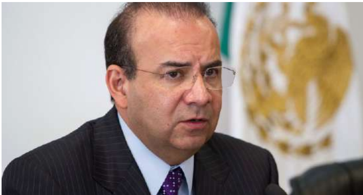
Lic. Alfonso Navarrete Prida.

El Secretario del Trabajo y Previsión Social, Lic. Alfonso Navarrete Prida, dio a conocer que los sectores productivos del país han avanzado para que a finales de este año se pueda homologar el salario mínimo las áreas geográficas A y B, pasando por una primera etapa en abril próximo donde dicha homologación será del 50 por ciento.