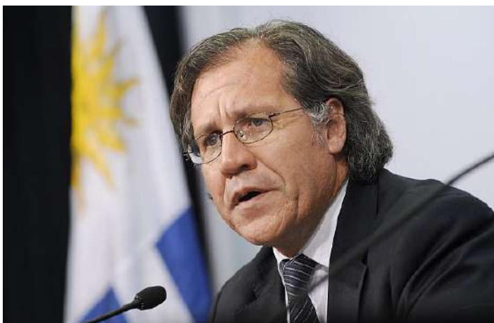
Luis Almagro, Secretario General de la OEA.

Almagro tomará posesión de su cargo el próximo 26 de mayo, una vez que el actual Secretario, José Miguel Insulza, termine su periodo.