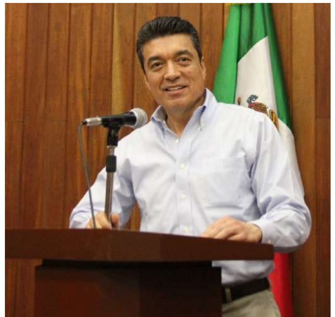
Dr. Rutilio Escandón Cadenas.

La institución federal destacó el compromiso de dicho juzgado para realizar una actividad jurisdiccional recta y profesional, ya que dentro del plazo establecido, este juzgado ordenó el retorno de dichos menores de edad a su lugar de residencia habitual.