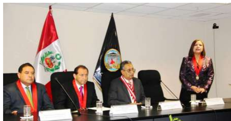
Autoridades en la mesa de honor en la inauguración del juzgado.