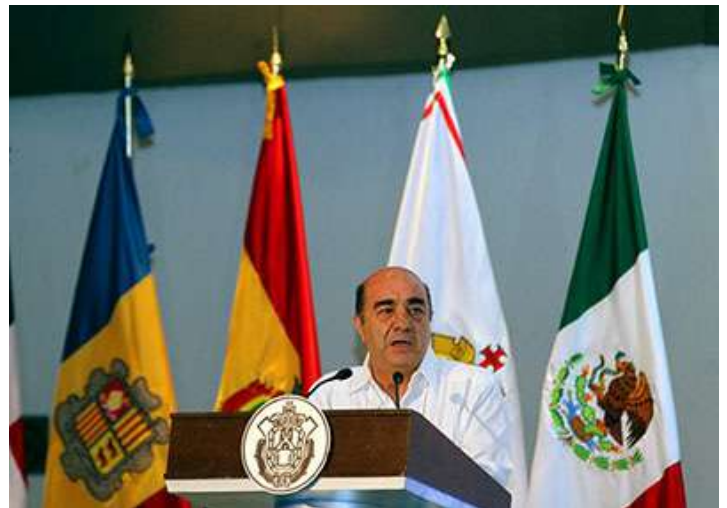
Lic. Jesús Murillo Karam.

En el foro participaron más de 350 alcaldes de Iberoamérica quienes tienen el objetivo de planear estrategias que coadyuven en la generación de centros urbanos inteligentes, que propicien la consolidación de ciudades productivas, competitivas, eficientes, sostenibles e inclusivas.