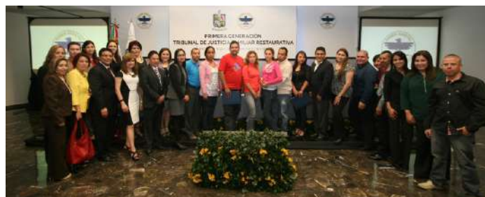
Primera Generación del Tribunal de Justicia Familiar Restaurativa.

Se logran primeros frutos del Tribunal de Justicia Familiar Restaurativa, programa que el Poder Judicial de Nuevo León puso en marcha para el tratamiento, reinserción y vigilancia para la familia.