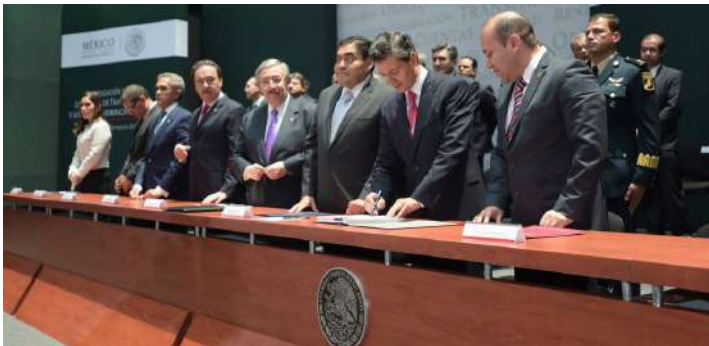
Presidente Enrique Peña Nieto firma la promulgación de la nueva ley.

El pasado lunes 4 de mayo, el Presidente de la República, Lic. Enrique Peña Nieto promulgó la nueva Ley General de Transparencia y Acceso a la Información Pública , la cual obliga a las autoridades de los tres poderes de la unión, órganos autónomos, sindicatos y a cualquier persona física o moral que ejerza recursos públicos, a transparentar la información que generen.