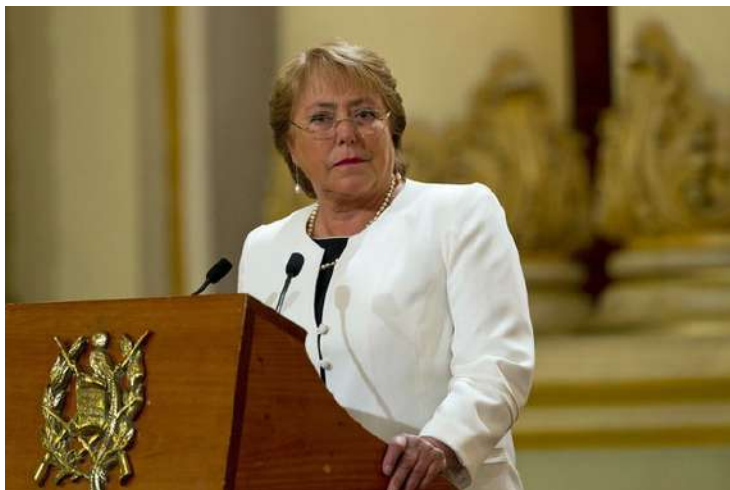
La Presidenta Michelle Bachelet.

La Presidenta chilena, Michelle Bachelet, cambió a nueve ministros, en una decisión que incluyó la inédita remoción del titular de Hacienda, para dar un giro a la segunda etapa de su mandato y retomar la agenda de reformas opacadas por una baja en su aprobación tras escándalos de corrupción.