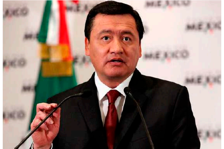
Secretario de Gobernación, Miguel Ángel Osorio Chong.

“Me parece muy bien que la discusión pueda iniciarse en el Congreso, pero indiscutiblemente repercute en toda la sociedad. Que se abra y que se definan políticas públicas. Nosotros estamos abiertos a los resolutivos de ese debate”, manifestó el Funcionario.