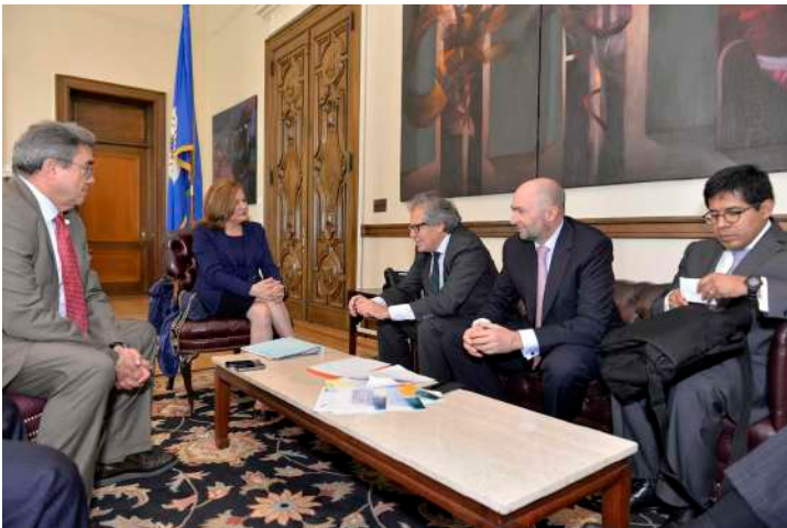
Mtra. Arely Gómez durante su gira de trabajo.