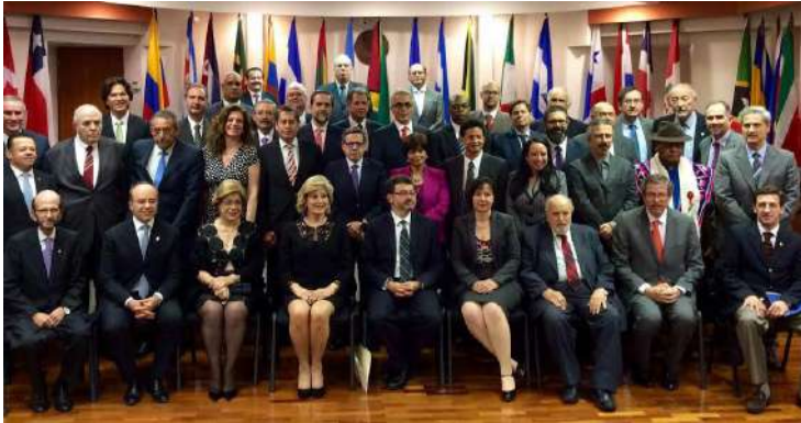
Fotografía oficial del encuentro.

Ante ministros y magistrados de tribunales constitucionales de América Latina, y jueces de la Corte Interamericana de Derechos Humanos, el Presidente de la Suprema Corte de Justicia de la Nación (SCJN), Luis María Aguilar Morales, refrendó su compromiso en la protección y promoción de los derechos humanos.