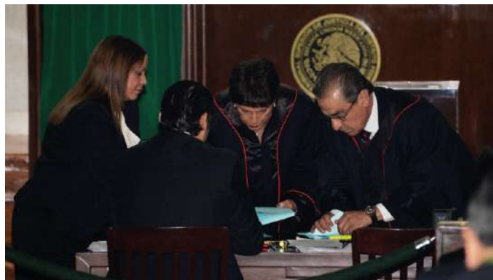
Conteo de votos.

Con información de: Poder Judicial del Distrito Federal.