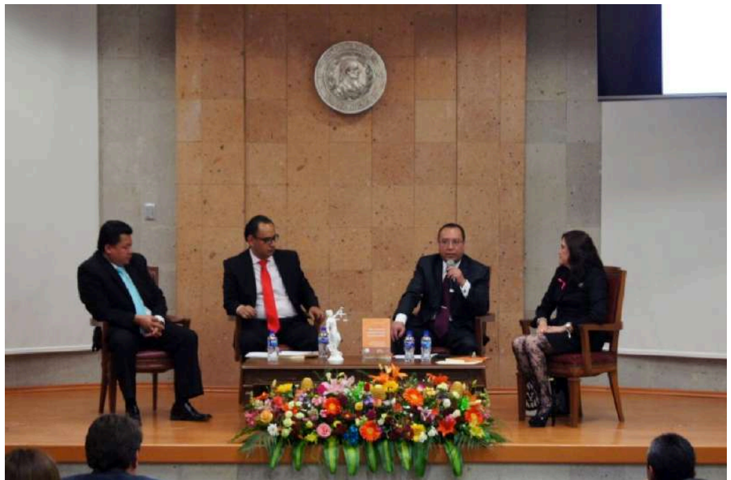
Panel encargado de la presentación del libro.