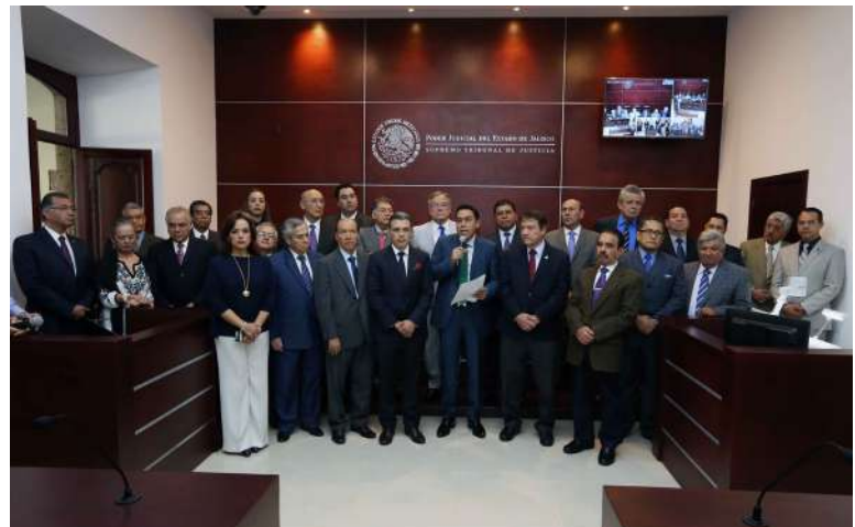
Magistrado Luis Carlos Vega Pámanes, durante la declaratoria inaugural.

HD con zoom óptico para presentar pruebas, equipo de cómputo de alto rendimiento, Ipad para que el juez tenga el control de las salas, micrófonos de cuello de ganso y ambientales de alta definición, equipo de sonido y equipo de comunicaciones, mezcladores y procesadores digitales de última generación, servi-