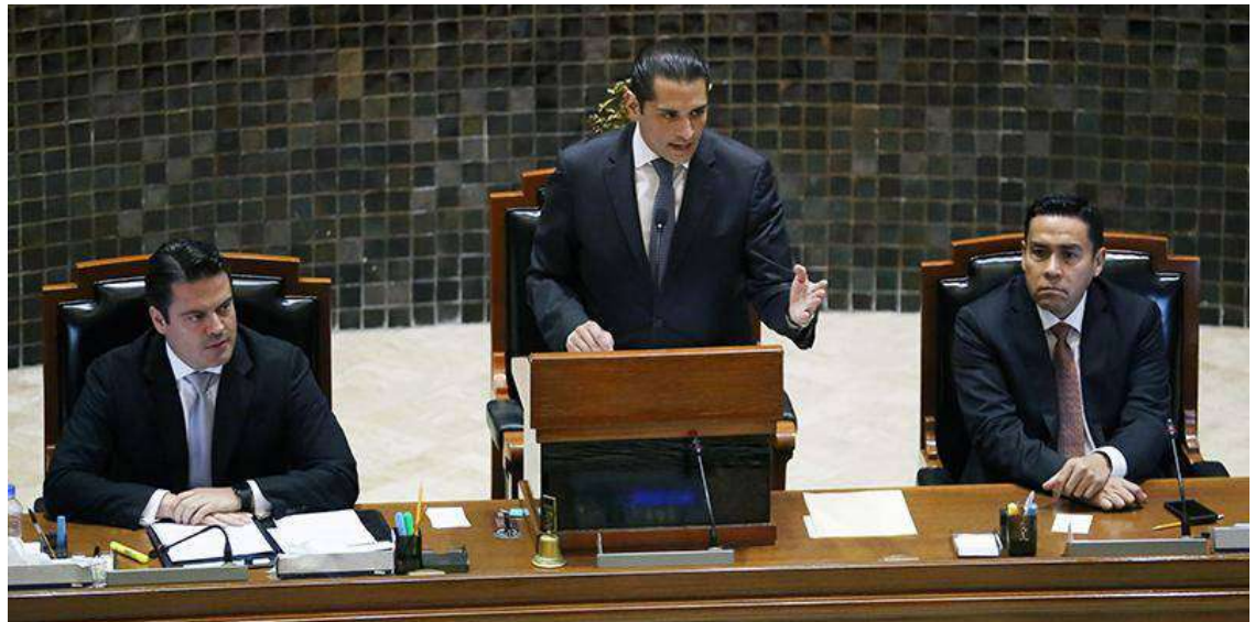
A la derecha, el Magistrado Luis Carlos Vega Pámanes durante la instalación de la LXI Legislatura.

“Los magistrados, deberían de ser revisados y nombrados por el pleno del Supremo Tribunal de Justicia y no por el Congreso. Porque somos nosotros quienes conocemos desde raíz el funcionamiento de