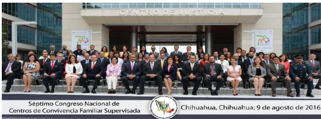
Séptimo Congreso Nacional de Centros de Convivencia Familiar Supervisada