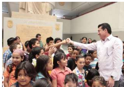
Dr. Rutilio Escandón Cadenas.

El Instituto de Formación Judicial además de impulsar la capacitación jurídica, ahora también se encarga de materializar programas educativos dirigidos a los menores de edad, para que cuando los pequeños después de la