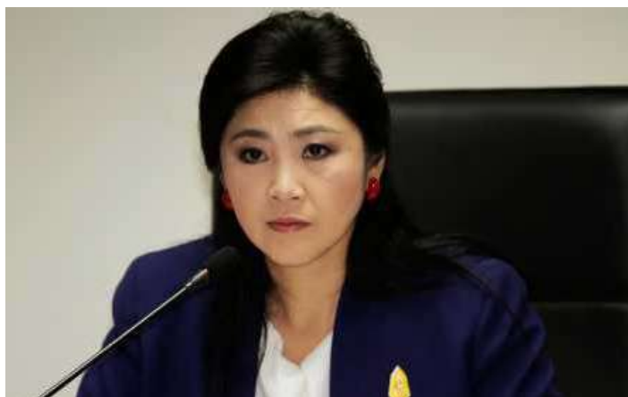
Primera Ministra, Yingluck Shinawatra.

El Tribunal Constitucional de Tailandia ha ordenado a la primera ministra, Yingluck Shinawatra, que abandone su cargo por abuso de poder, con lo que se acrecenta aún más la crisis política que vive Tailandia desde que en 2006 Thaksin Shinawatra, hermano de Yingluck y antiguo magnate de las telecomunicaciones, fuera expulsado del Gobierno mediante un golpe del Ejército, tras intensas protestas en las que fue acusado de corrupción, abuso de poder y falta de respeto al rey Bhumibol Adulyadej.