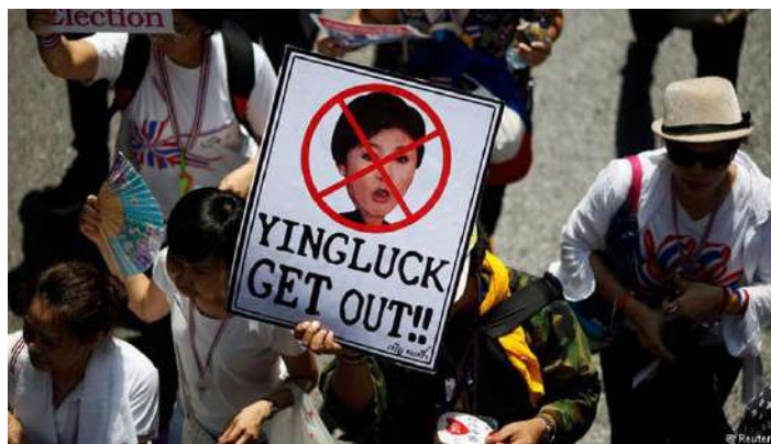
Protestas en Tailandia.