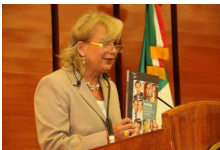
Ministra Olga Sánchez Cordero.

El 13 de mayo se realizó la inauguración del Foro Impartición de Justicia con Perspectiva de Género que realizó la CONATRIB, en colaboración con el Instituto Nacional de las Mujeres (INMUJERES), en el que se contó con la asistencia de representantes de 31 tribunales superiores de la República.